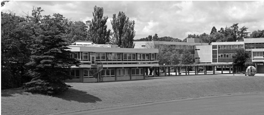
Ecole de Centrale de Lyon, Frankreich